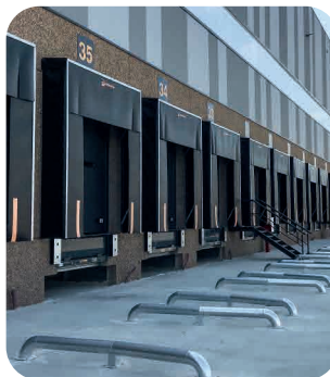
Guías de camión reversibles totalmente galvanizadas.