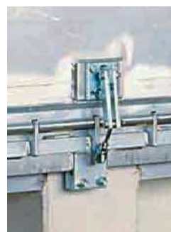
Syst. compensation mécanique.