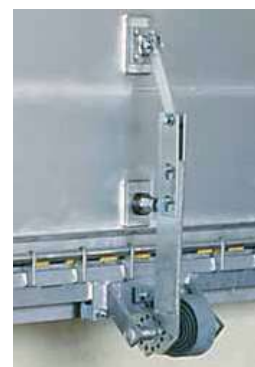
Syst. compensation avec ressorts.