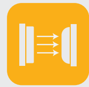
Fotocélula de seguridad.