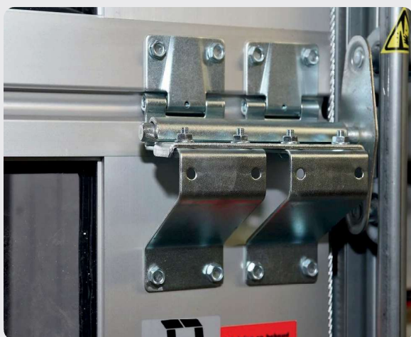
Joint de panneaux de portes sectionnelles

La porte sectionnelle rapide PSER à panneaux est extrêmement robuste et convient à une utilisation intérieure et extérieure. Pour une sécurité accrue, elle peut être équipée de sections transparentes.