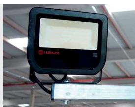
Luminaire de quai de chargement à LED - GE02

Inkema propose une large gamme d'accessoires qui permet à ses clients de personnaliser les quais de chargement en fonction de leurs besoins et de leurs exigences.