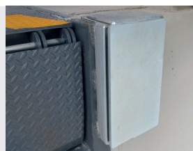
Butoir en acier-caoutchouc - TC05