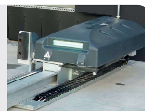
Système de retenue automatique - CS12