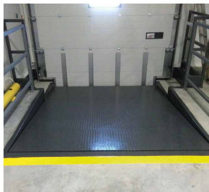
Superficie superior lagrimada antideslizante