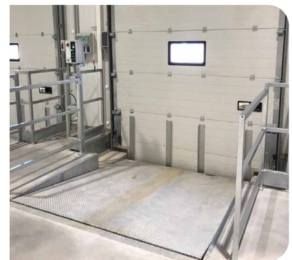
Las RH31 son adecuados para cualquier sector industrial