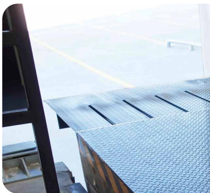
Labio retráctil de 1.000mm extendido (RH31)